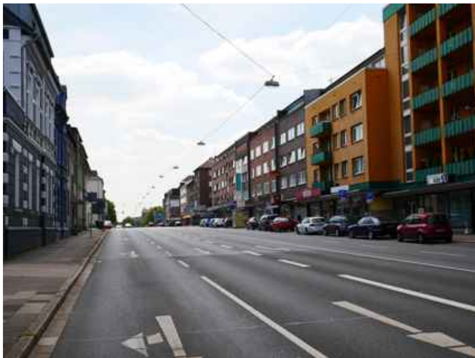
Abbildung 4: Oberhausen Mülheimer Straße (Juli 2018)