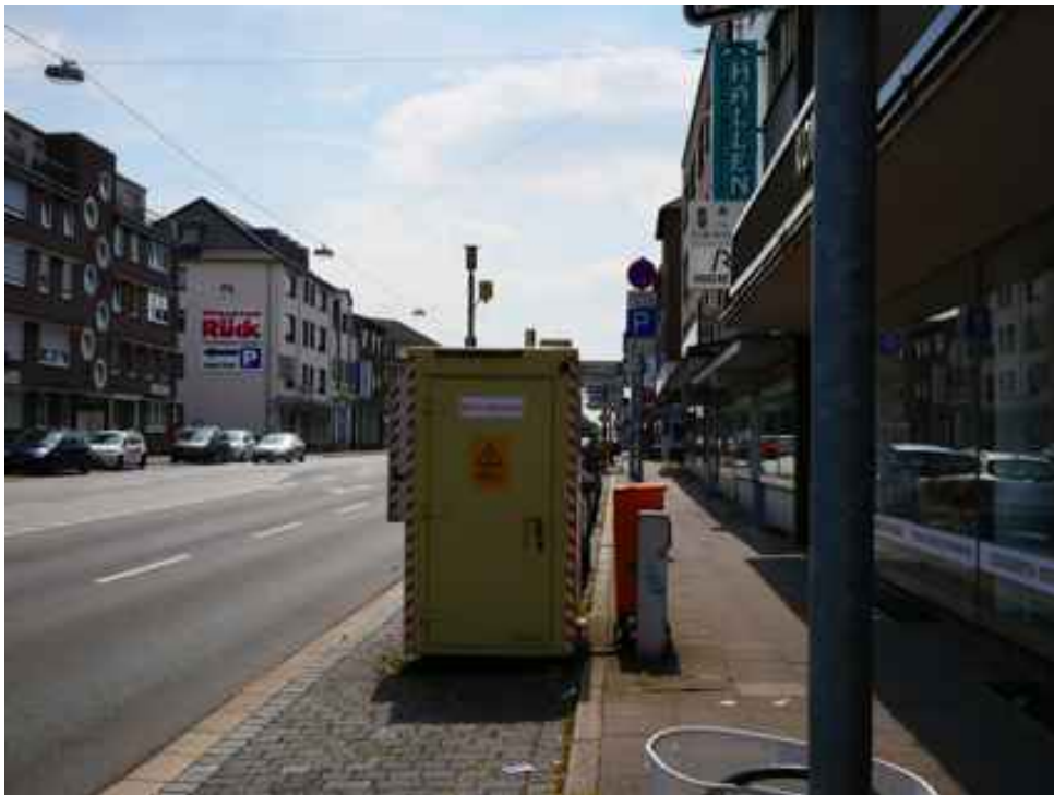
Abbildung 13: Zusätzliche Ansicht - Oberhausen Mülheimer Straße (Juli 2018)