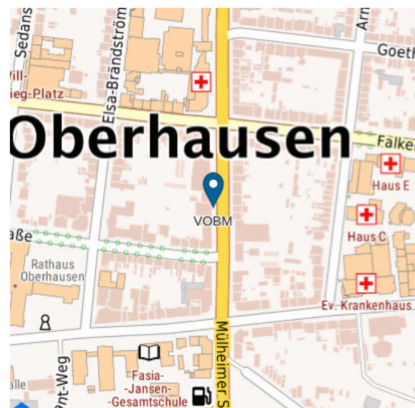
Abbildung 2: Kartenübersicht - Oberhausen Mülheimer Straße