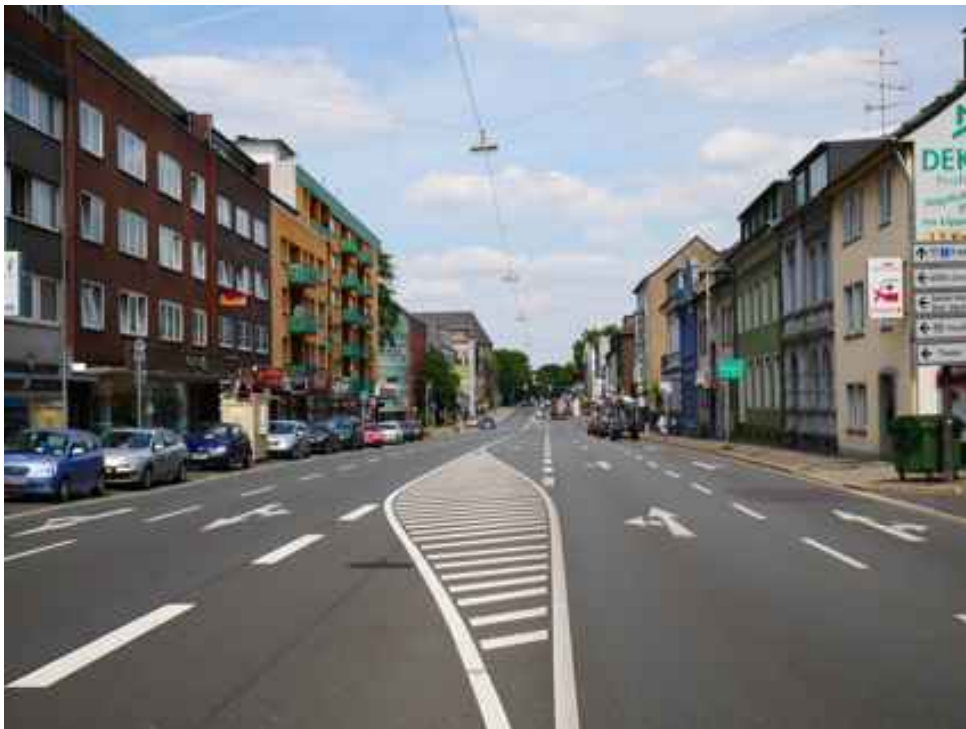
Abbildung 17: Zusätzliche Ansicht - Oberhausen Mülheimer Straße (Juli 2018)