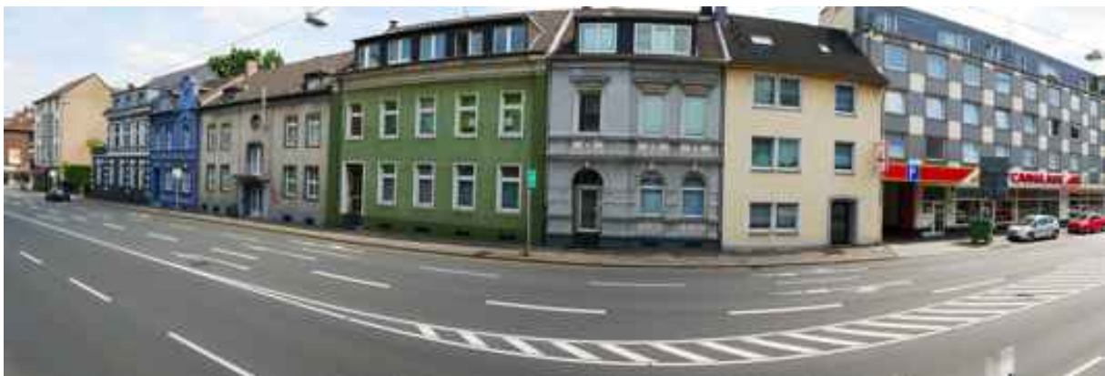
Abbildung 10: Panorama Richtung Osten (Juli 2018)