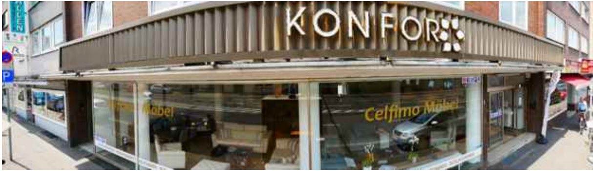
Abbildung 12: Panorama Richtung Westen (Juli 2018)