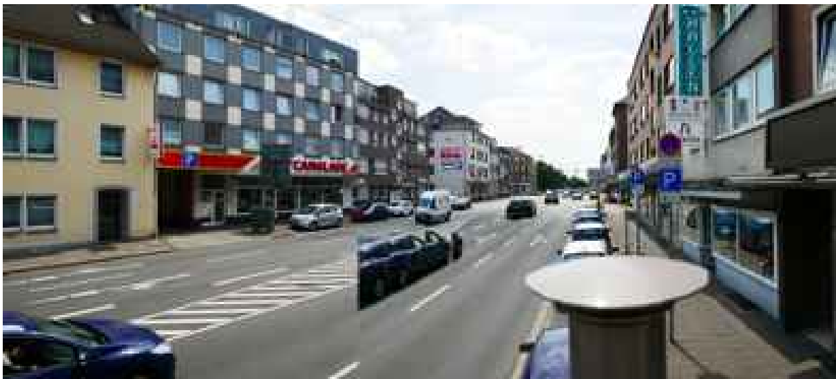
Abbildung 11: Panorama Richtung Süden (Juli 2018)