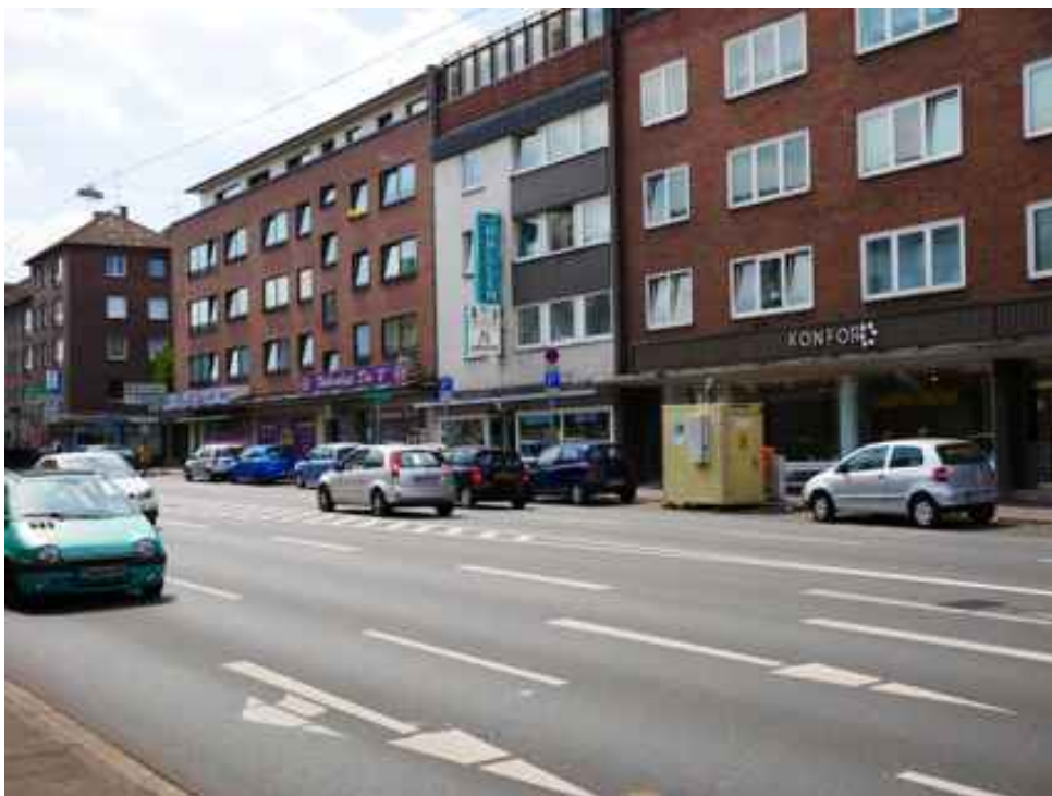
Abbildung 15: Zusätzliche Ansicht - Oberhausen Mülheimer Straße (Juli 2018)