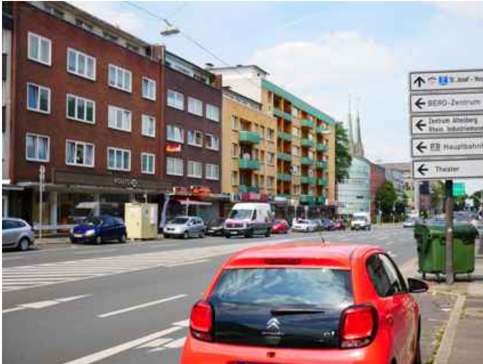
Abbildung 16: Zusätzliche Ansicht - Oberhausen Mülheimer Straße (Juli 2018)