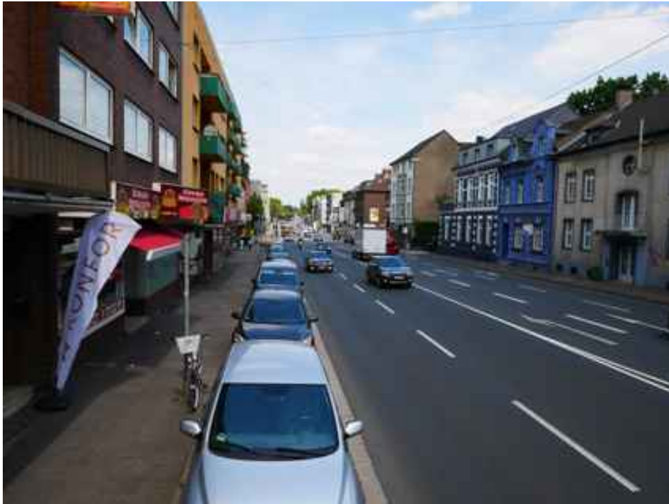
Abbildung 5: Blickrichtung Norden (Juli 2018)