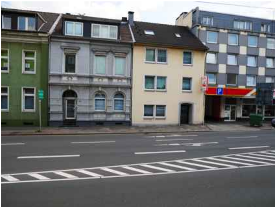
Abbildung 6: Blickrichtung Osten (Juli 2018)