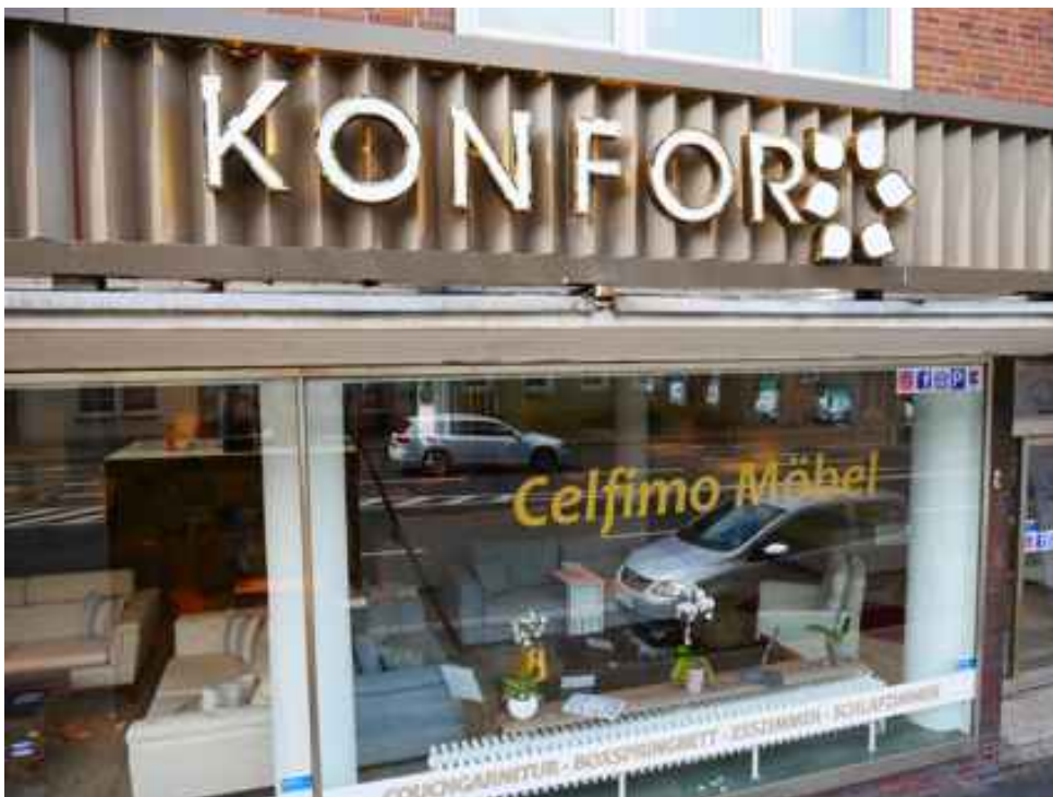
Abbildung 8: Blickrichtung Westen (Juli 2018)