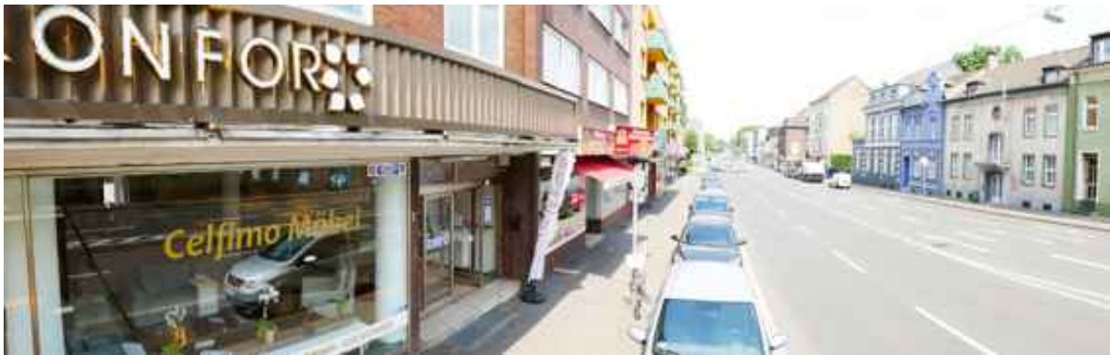
Abbildung 9: Panorama Richtung Norden (Juli 2018)