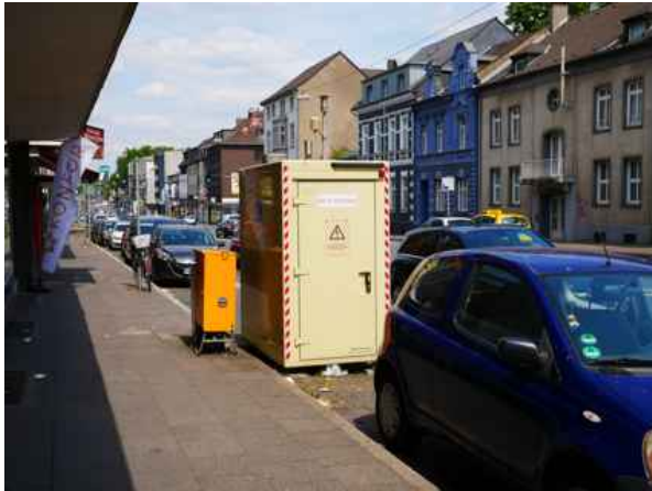
Abbildung 1: Oberhausen Mülheimer Straße