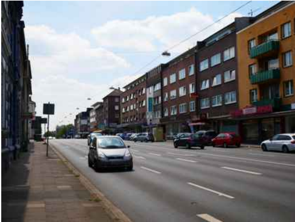
Abbildung 14: Zusätzliche Ansicht - Oberhausen Mülheimer Straße (Juli 2018)