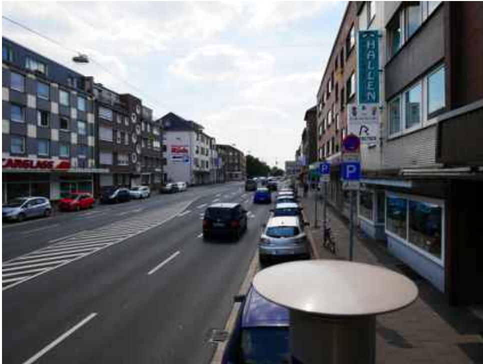
Abbildung 7: Blickrichtung Süden (Juli 2018)