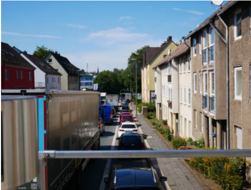
Abbildung 8: Blickrichtung Westen (August 2022)