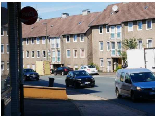
Abbildung 1: Lüdenscheid Lennestraße