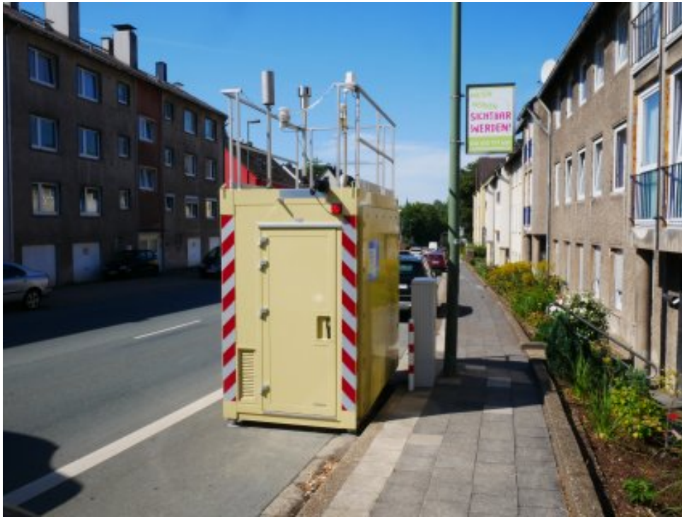
Abbildung 4: Lüdenscheid Lennestraße (August 2022)