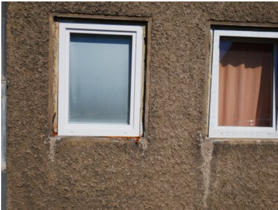
Abbildung 5: Blickrichtung Norden (August 2022)