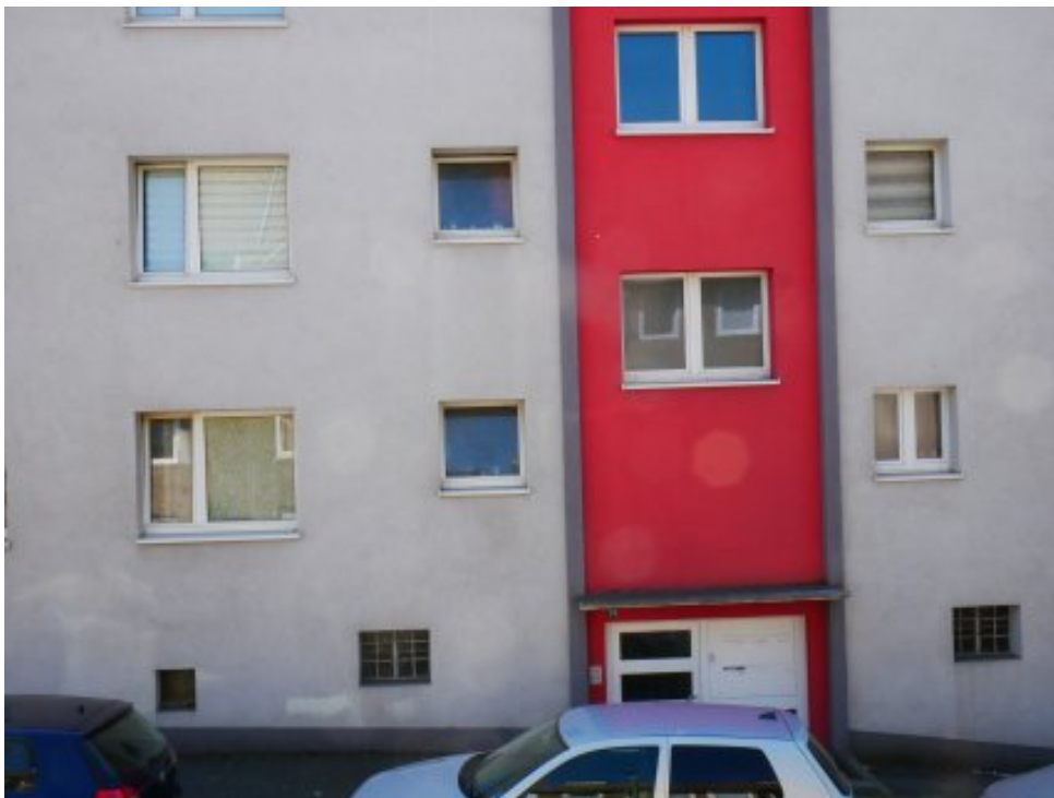
Abbildung 7: Blickrichtung Süden (August 2022)