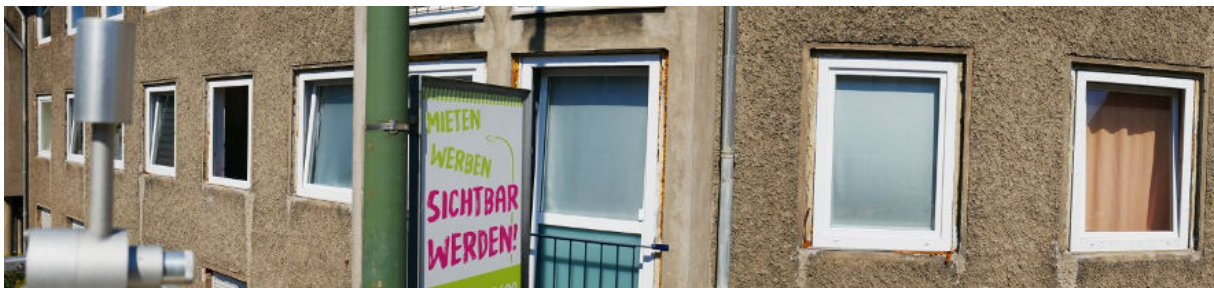
Abbildung 9: Panorama Richtung Norden (August 2022)