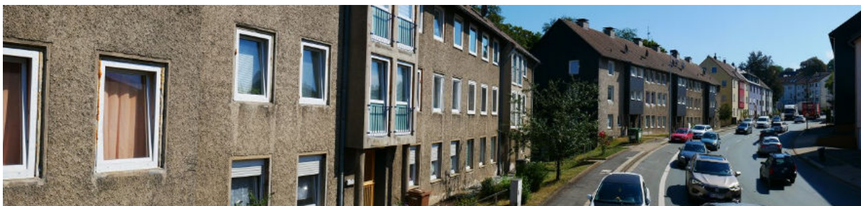
Abbildung 10: Panorama Richtung Osten (August 2022)