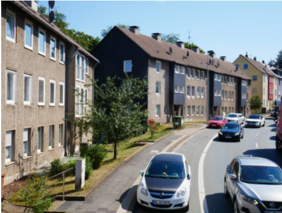
Abbildung 6: Blickrichtung Osten (August 2022)