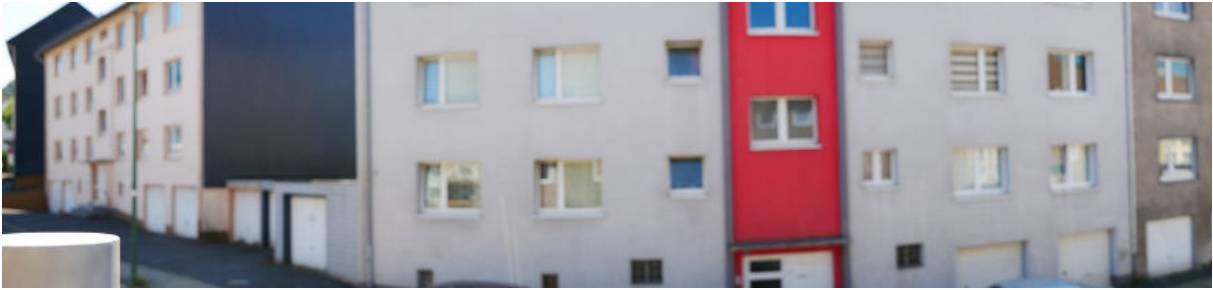
Abbildung 11: Panorama Richtung Süden (August 2022)