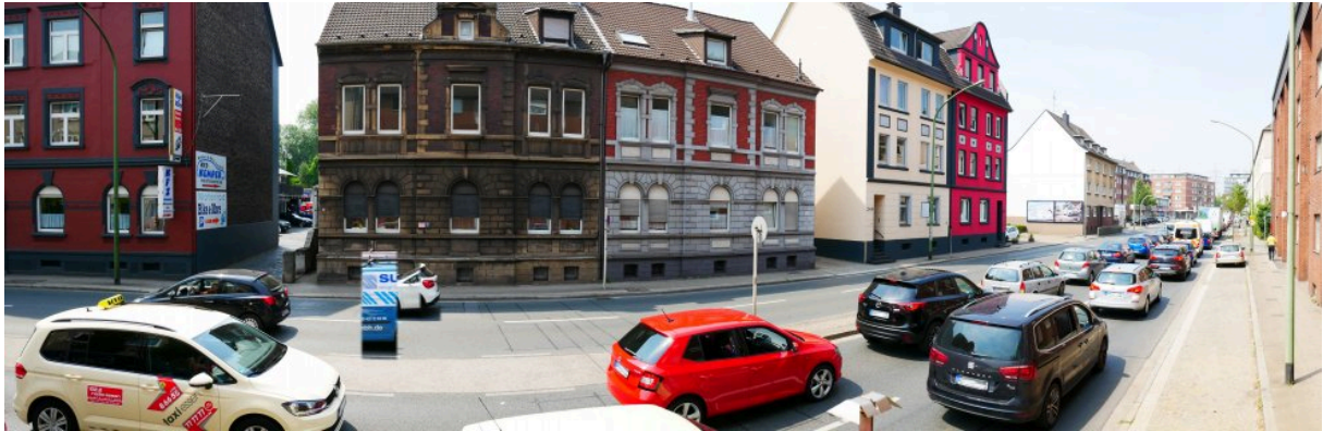
Abbildung 12: Panorama Richtung Westen (Juli 2018)