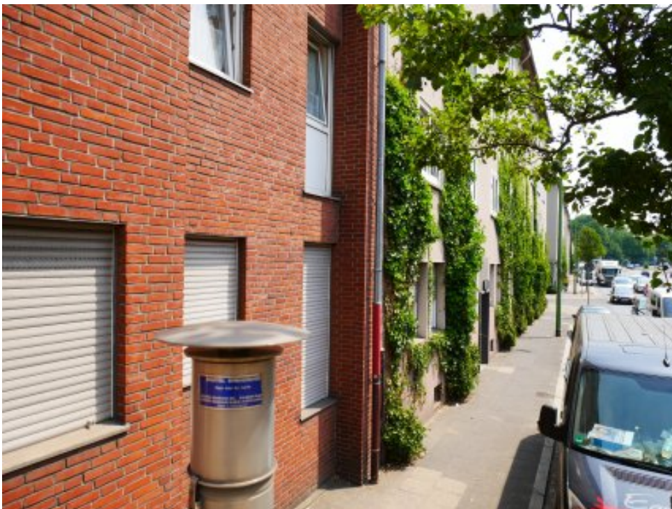
Abbildung 6: Blickrichtung Osten (Juli 2018)