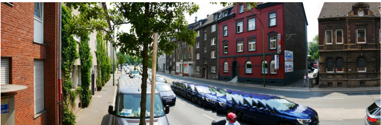
Abbildung 11: Panorama Richtung Süden (Juli 2018)