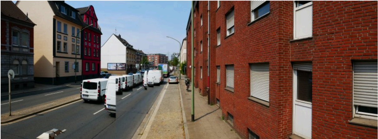
Abbildung 9: Panorama Richtung Norden (Juli 2018)