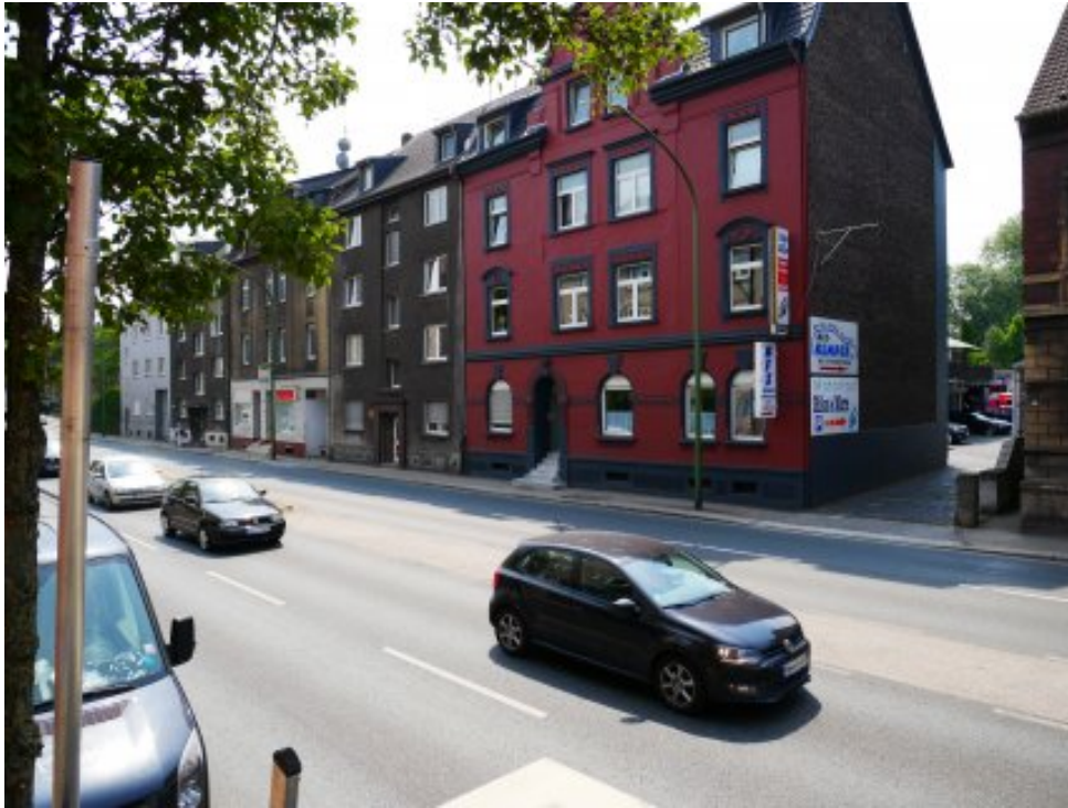
Abbildung 7: Blickrichtung Süden (Juli 2018)