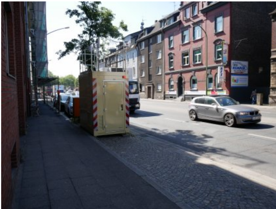
Abbildung 4: Essen Gladbecker Straße (Mai 2020)