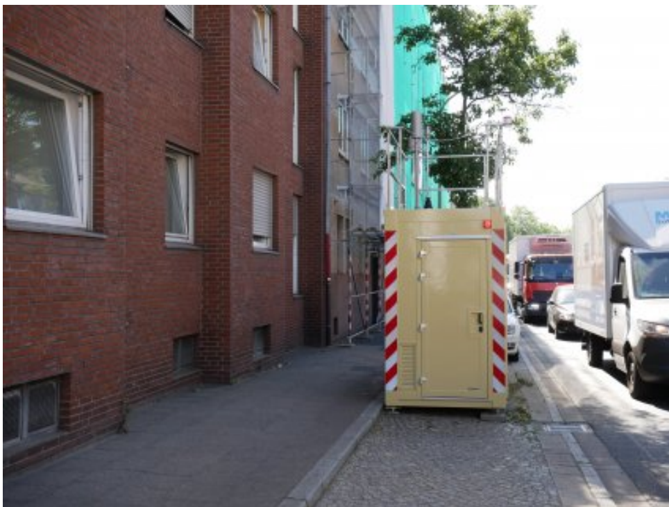
Abbildung 13: Zusätzliche Ansicht - Essen Gladbecker Straße (Mai 2020)