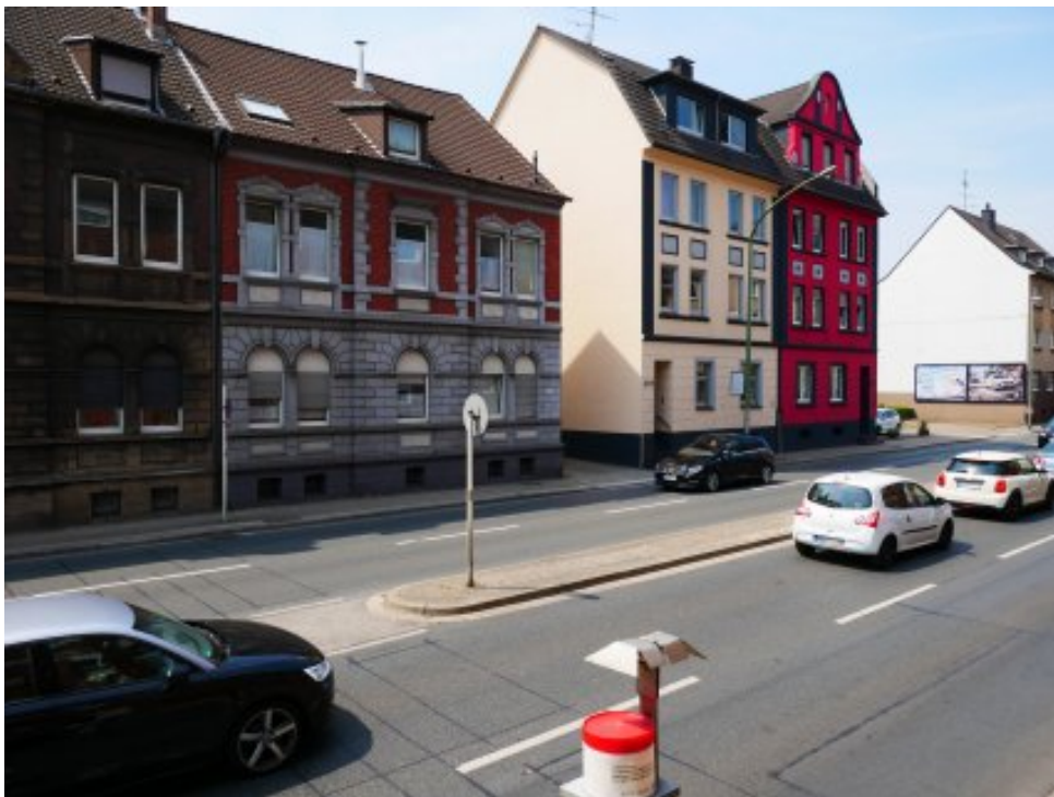
Abbildung 8: Blickrichtung Westen (Juli 2018)