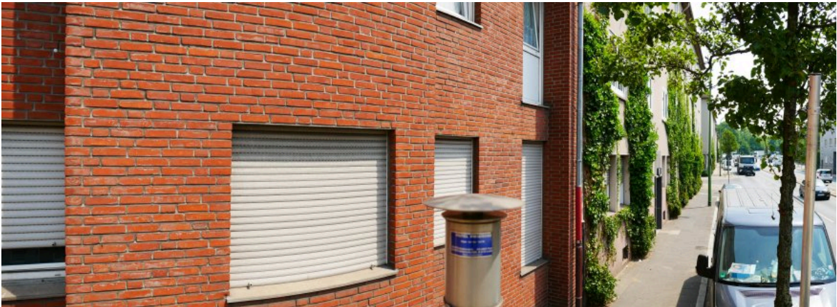
Abbildung 10: Panorama Richtung Osten (Juli 2018)