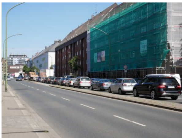
Abbildung 1: Essen Gladbecker Straße