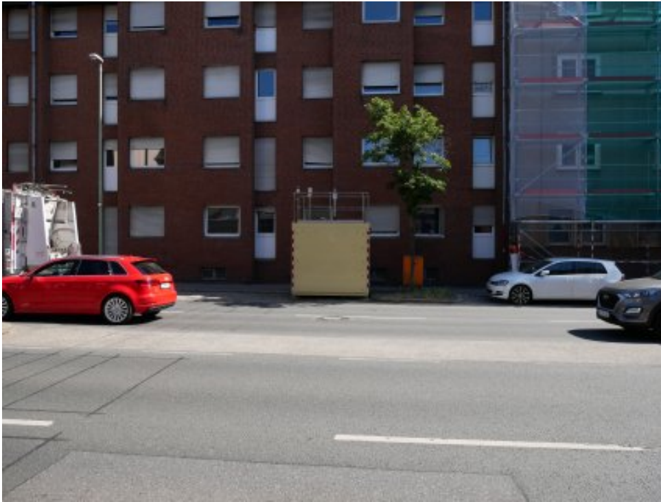
Abbildung 14: Zusätzliche Ansicht - Essen Gladbecker Straße (Mai 2020)