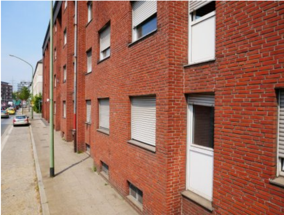
Abbildung 5: Blickrichtung Norden (Juli 2018)