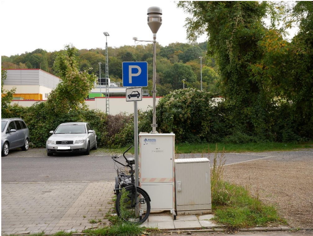
Feldgerät Stolberg Brauereistraße (STOB)