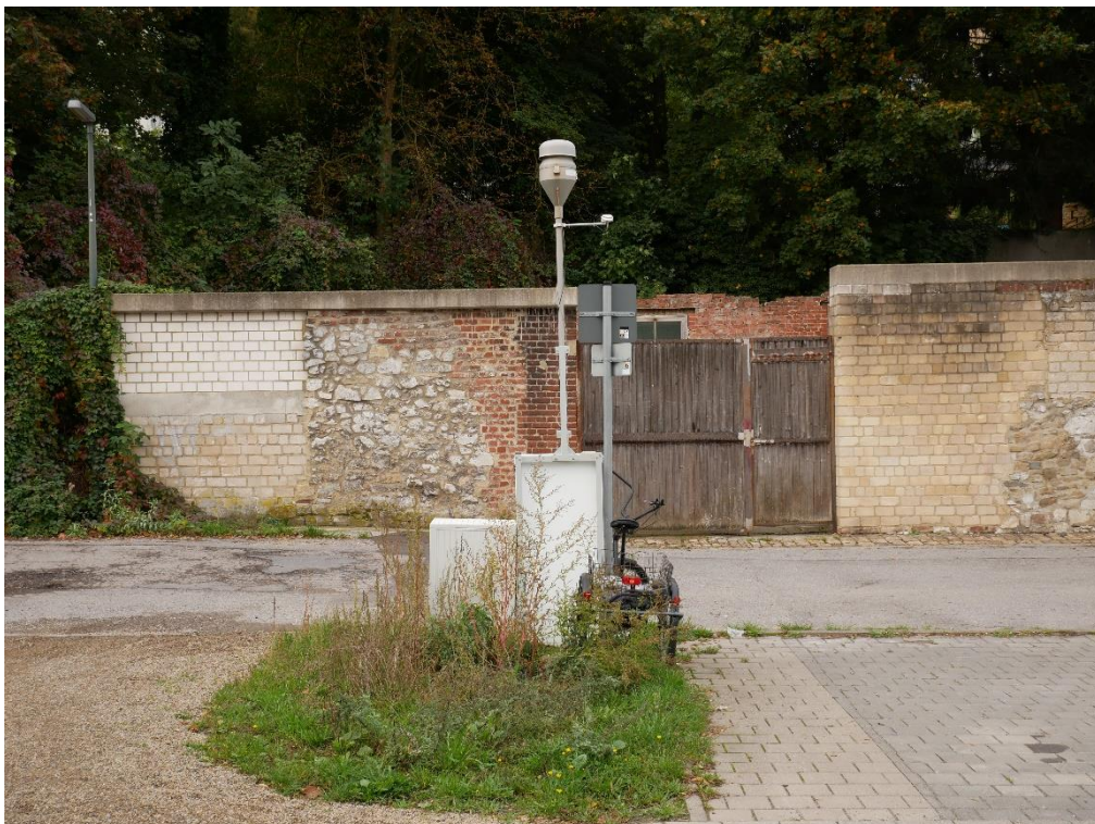
Feldgerät Stolberg Brauereistraße (STOB), Rückseite