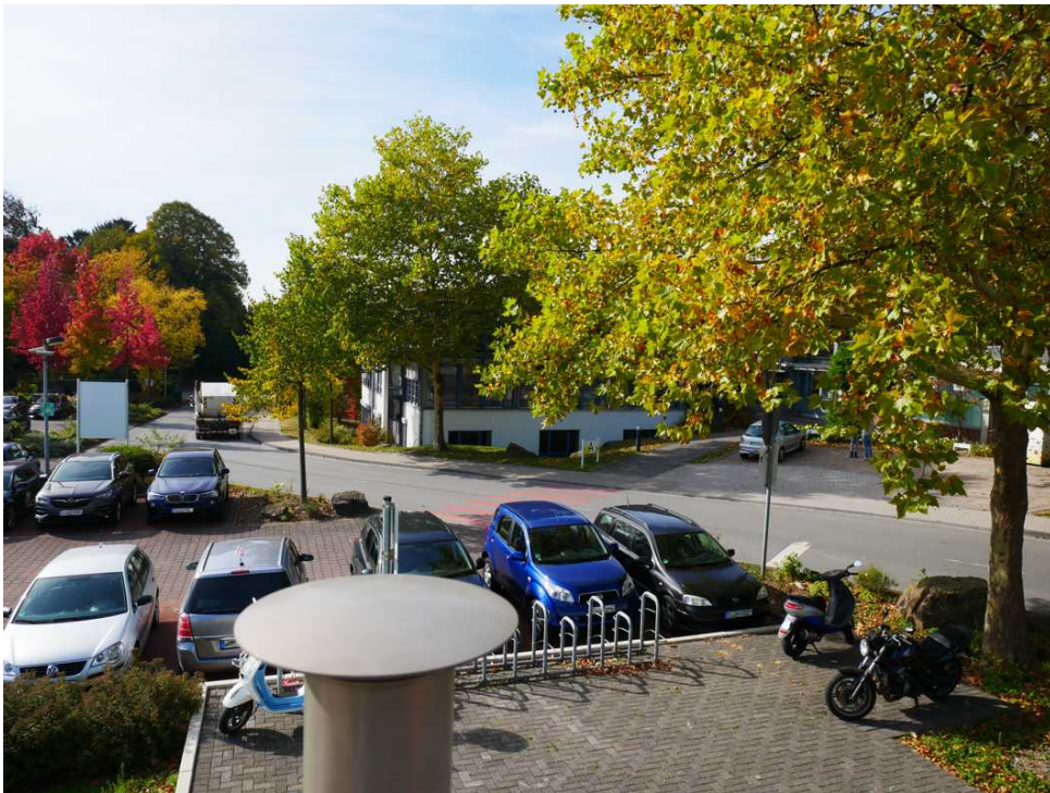
Abbildung 8: Blickrichtung Westen (Oktober 2018)