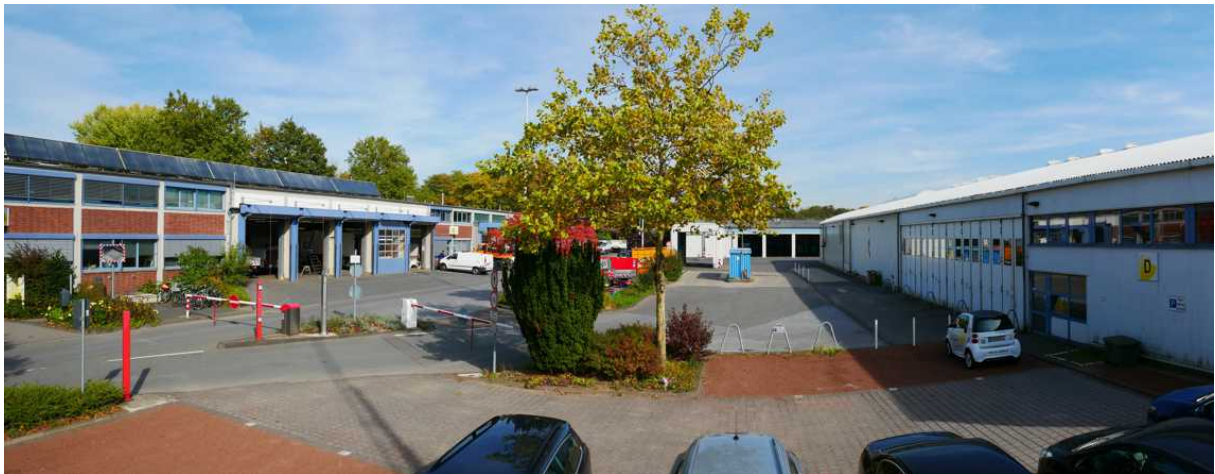
Abbildung 10: Panorama Richtung Osten (Oktober 2018)