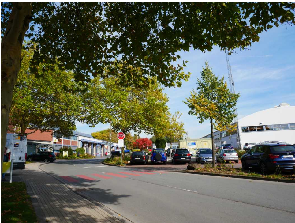
Abbildung 4: Solingen-Wald (Oktober 2018)