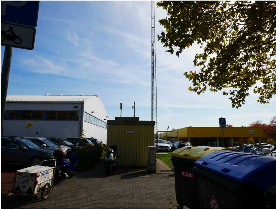
Abbildung 14: Zusätzliche Ansicht - Solingen-Wald (Oktober 2018)