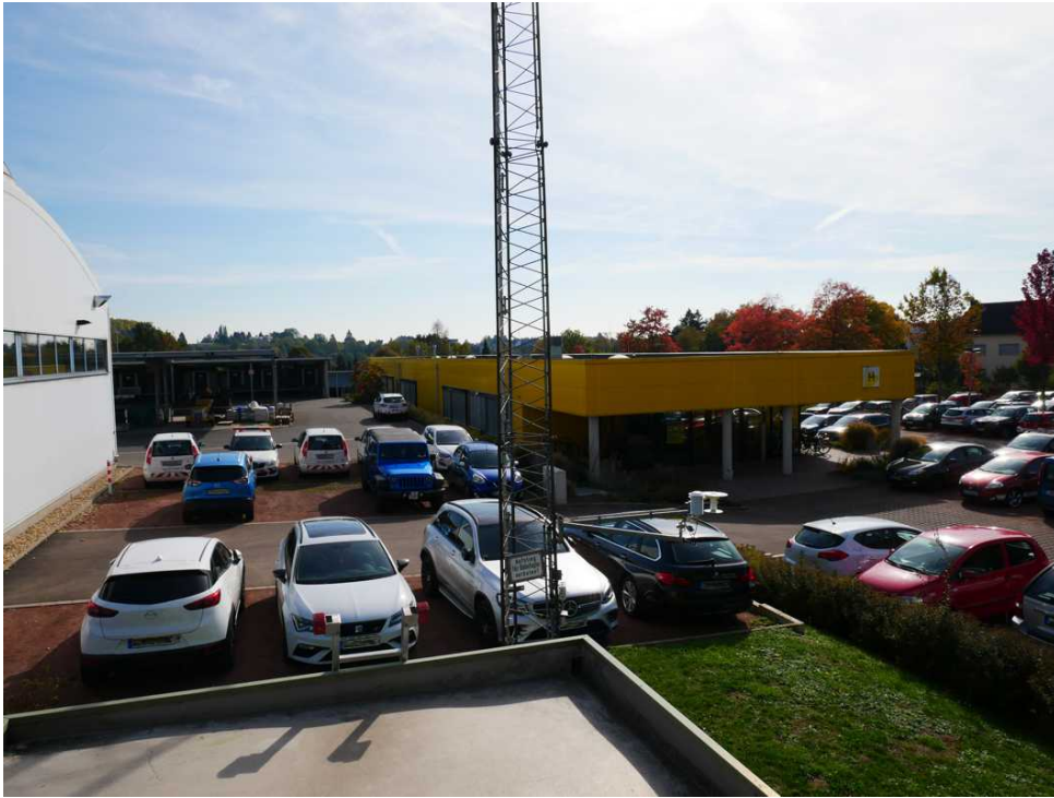
Abbildung 7: Blickrichtung Süden (Oktober 2018)