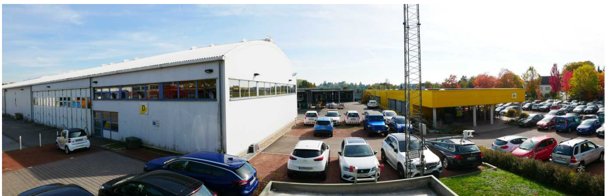
Abbildung 11: Panorama Richtung Süden (Oktober 2018)