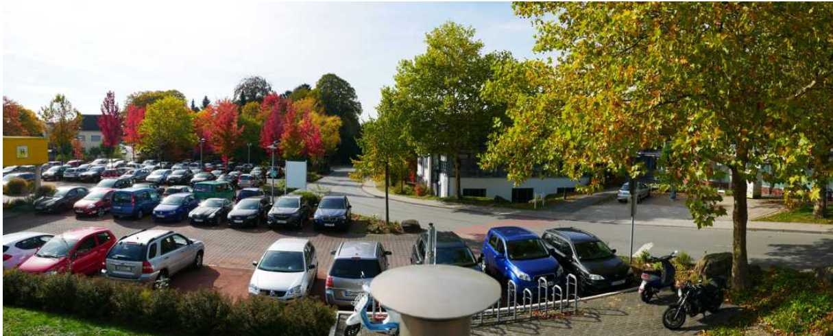
Abbildung 12: Panorama Richtung Westen (Oktober 2018)