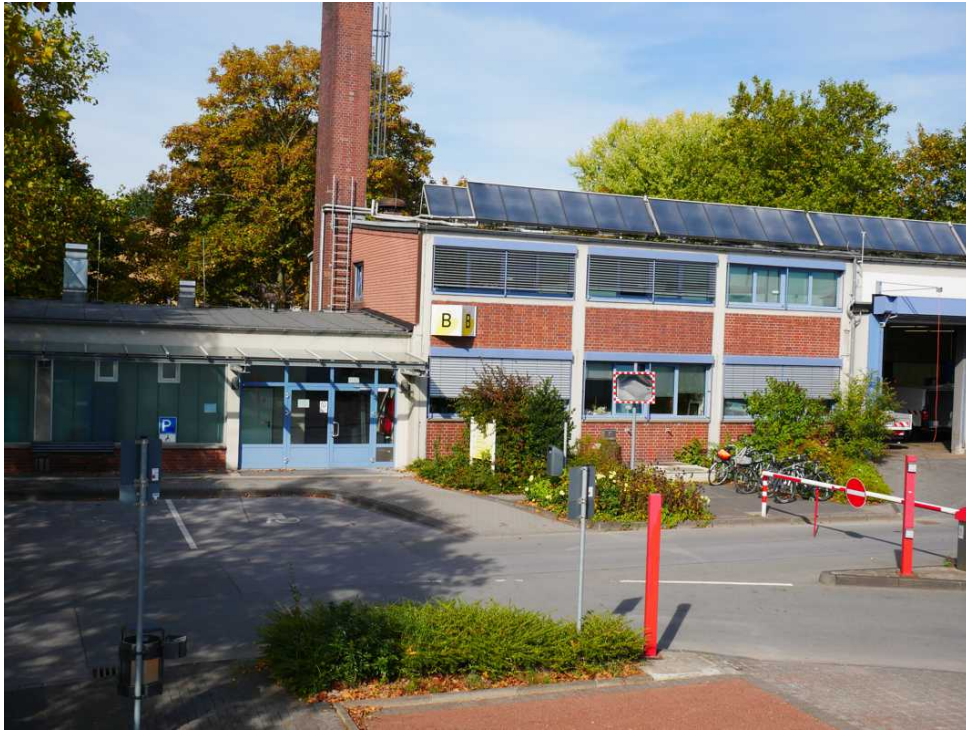
Abbildung 5: Blickrichtung Norden (Oktober 2018)