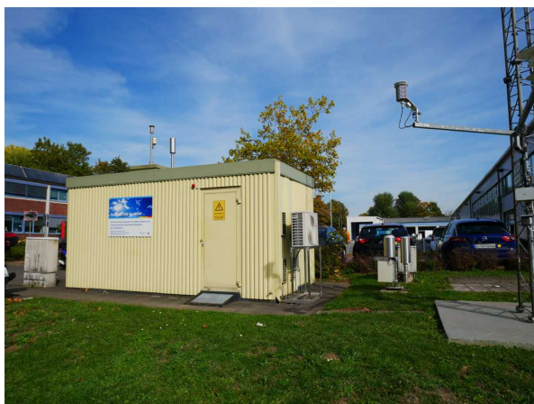
Abbildung 1: Solingen-Wald