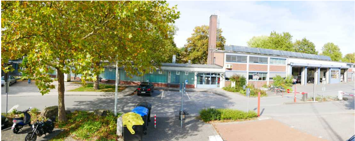
Abbildung 9: Panorama Richtung Norden (Oktober 2018)