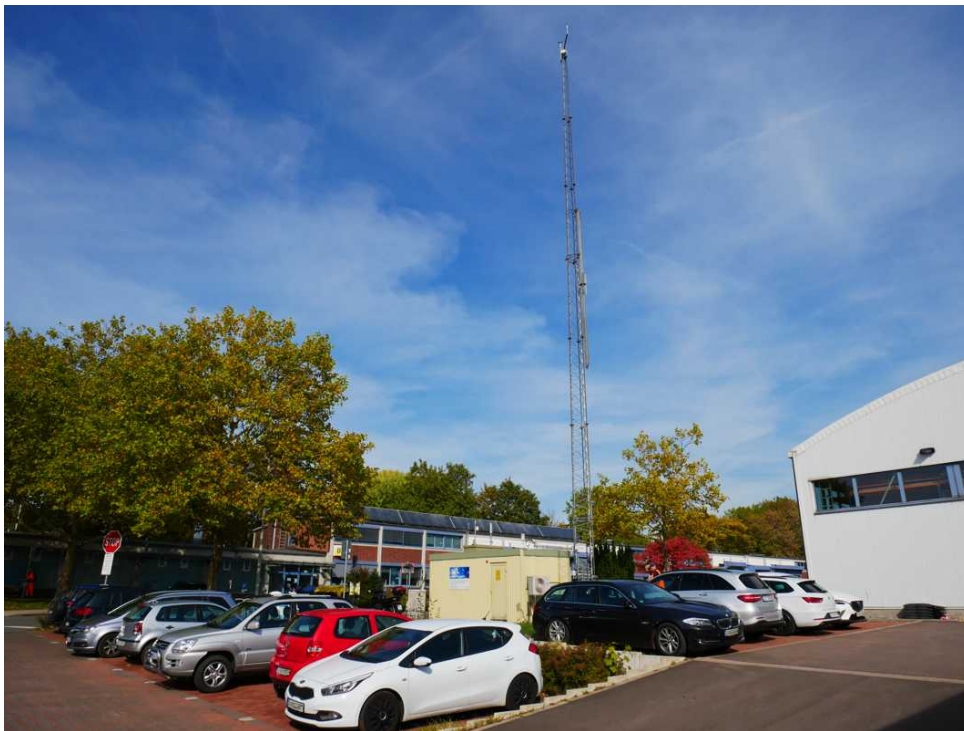
Abbildung 13: Zusätzliche Ansicht - Solingen-Wald (Oktober 2018)