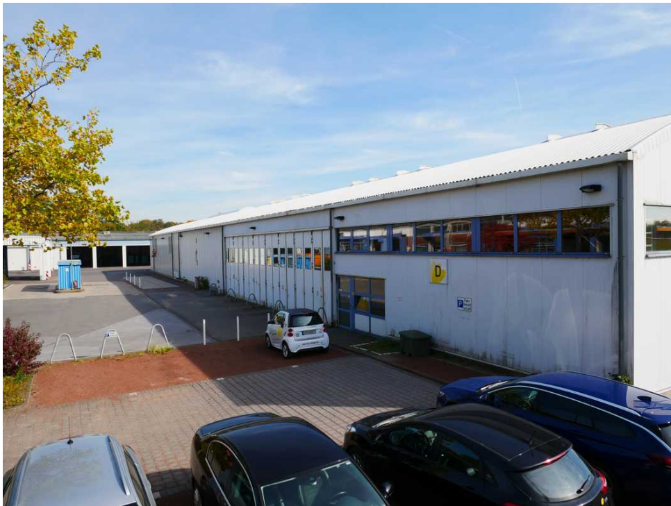
Abbildung 6: Blickrichtung Osten (Oktober 2018)