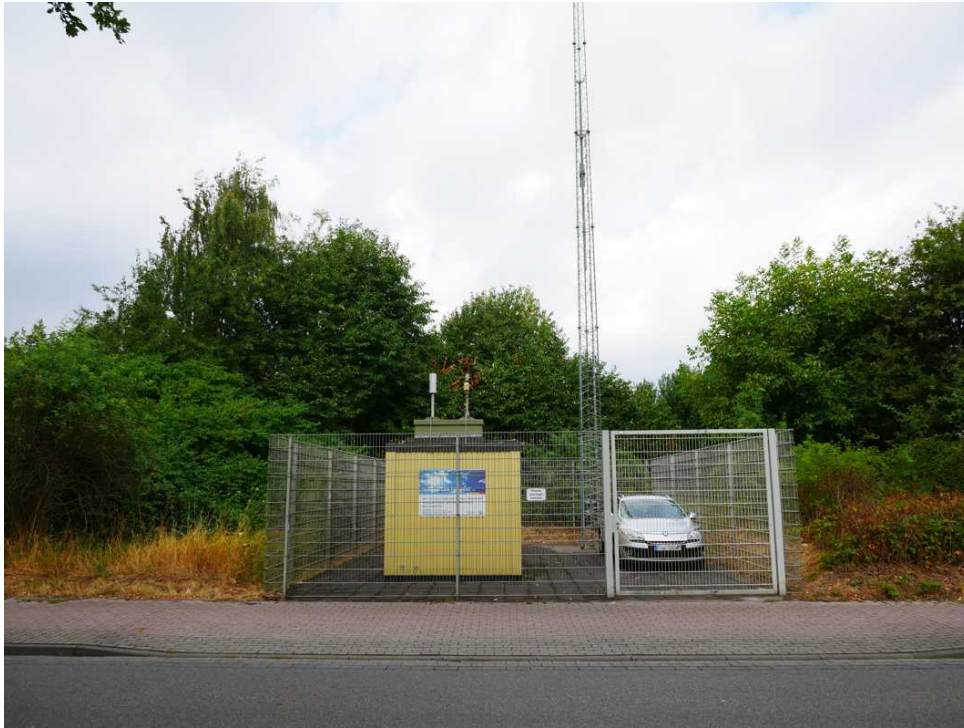
Abbildung 13: Zusätzliche Ansicht - Nettetal-Kaldenkirchen (August 2018)