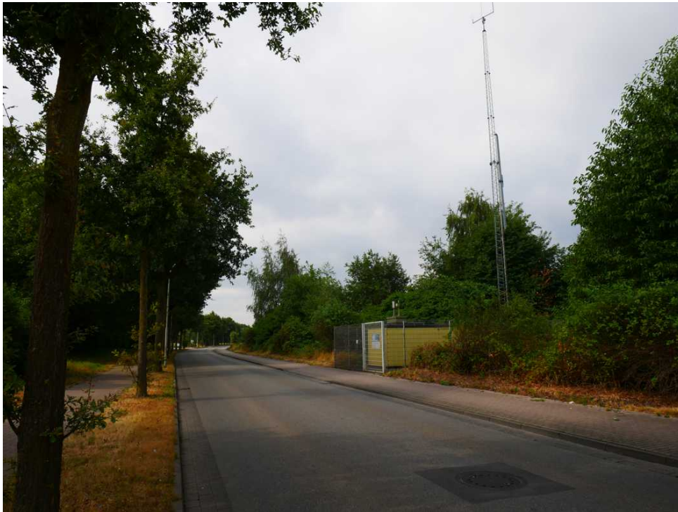
Abbildung 4: Nettetal-Kaldenkirchen (August 2018)