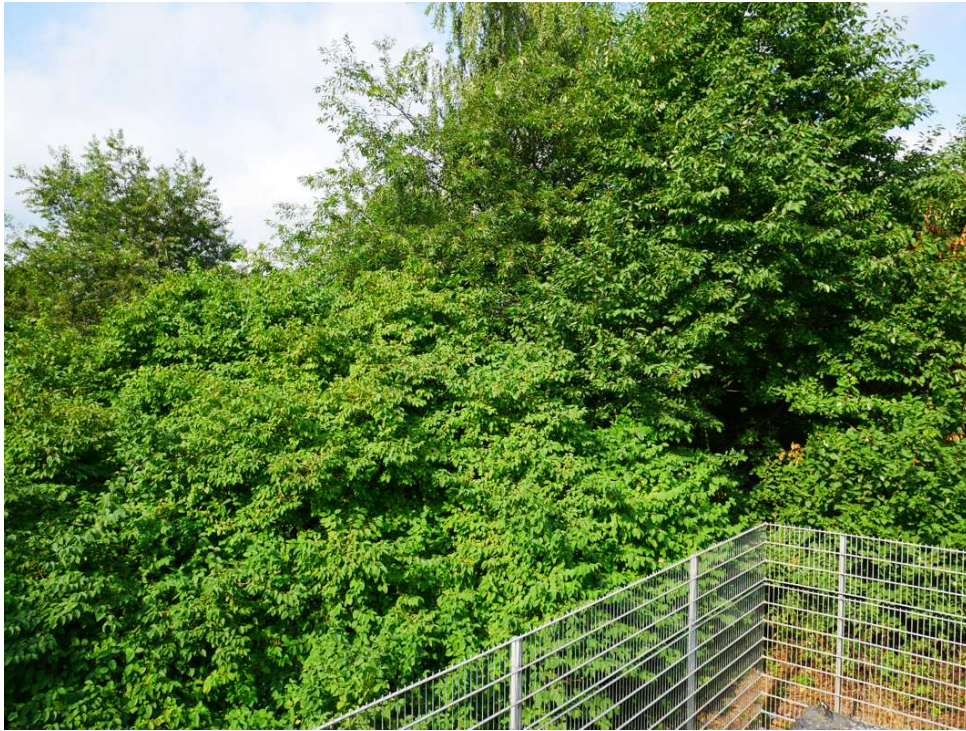
Abbildung 8: Blickrichtung Westen (August 2018)