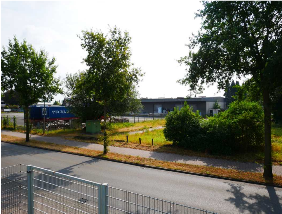
Abbildung 6: Blickrichtung Osten (August 2018)