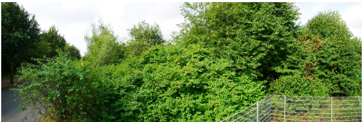
Abbildung 12: Panorama Richtung Westen (August 2018)