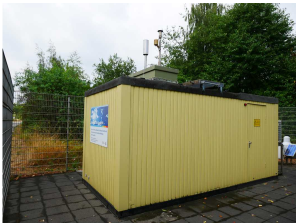
Abbildung 1: Nettetal-Kaldenkirchen