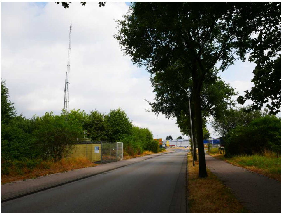
Abbildung 14: Zusätzliche Ansicht - Nettetal-Kaldenkirchen (August 2018)