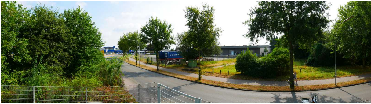
Abbildung 10: Panorama Richtung Osten (August 2018)