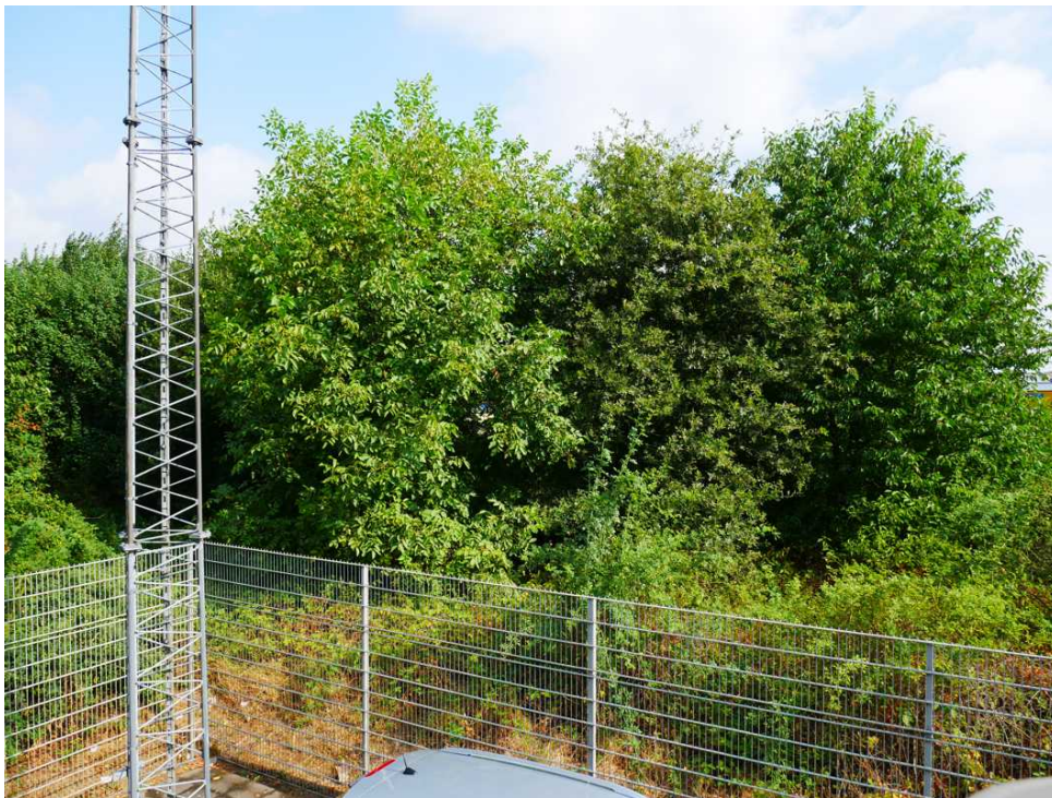
Abbildung 5: Blickrichtung Norden (August 2018)