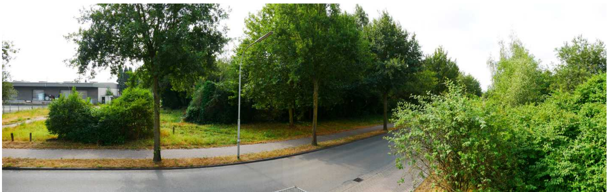
Abbildung 11: Panorama Richtung Süden (August 2018)