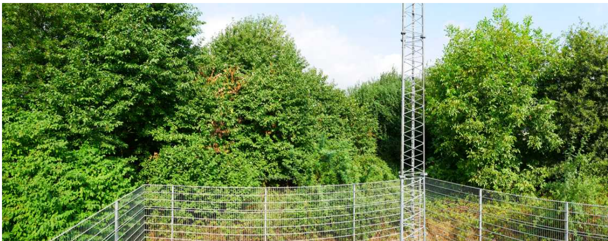
Abbildung 9: Panorama Richtung Norden (August 2018)