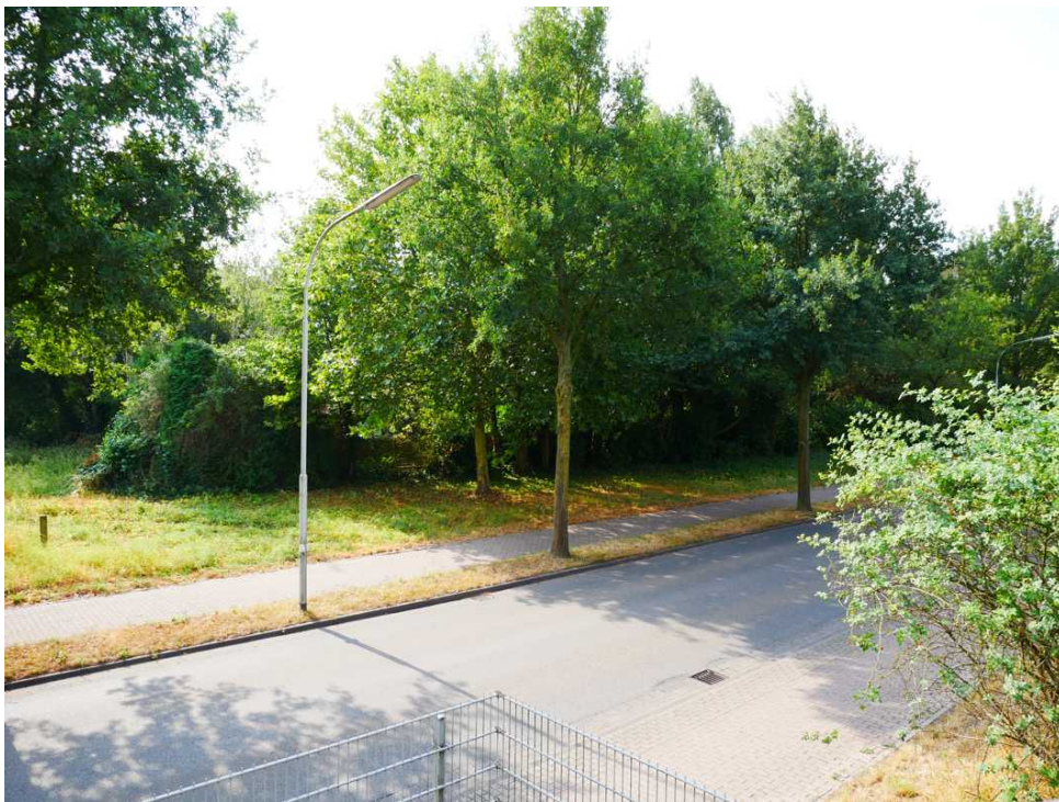
Abbildung 7: Blickrichtung Süden (August 2018)