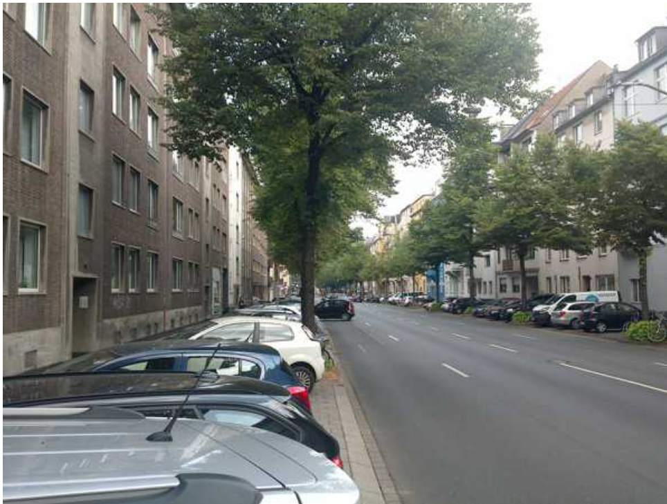
Abbildung 5: Blickrichtung Norden (Juli 2018)