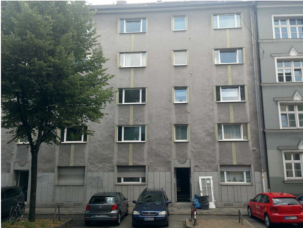
Abbildung 6: Blickrichtung Osten (Juli 2018)