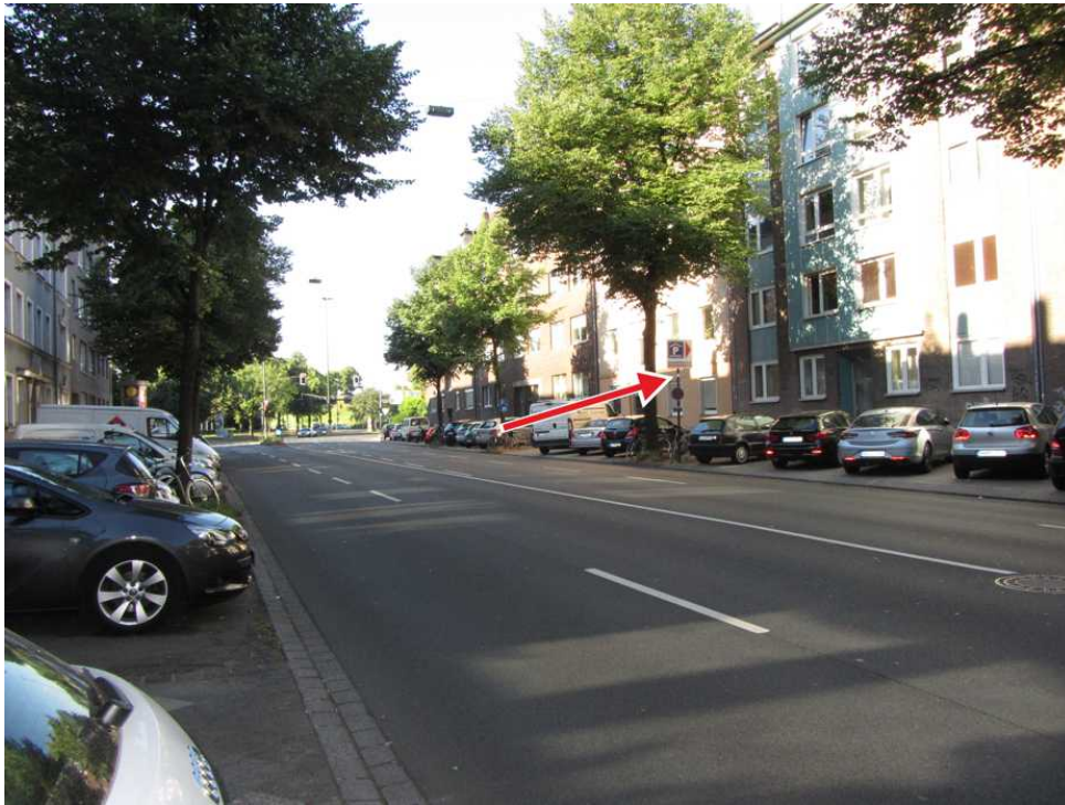
Abbildung 4: Düsseldorf-Bilk (Juli 2018)