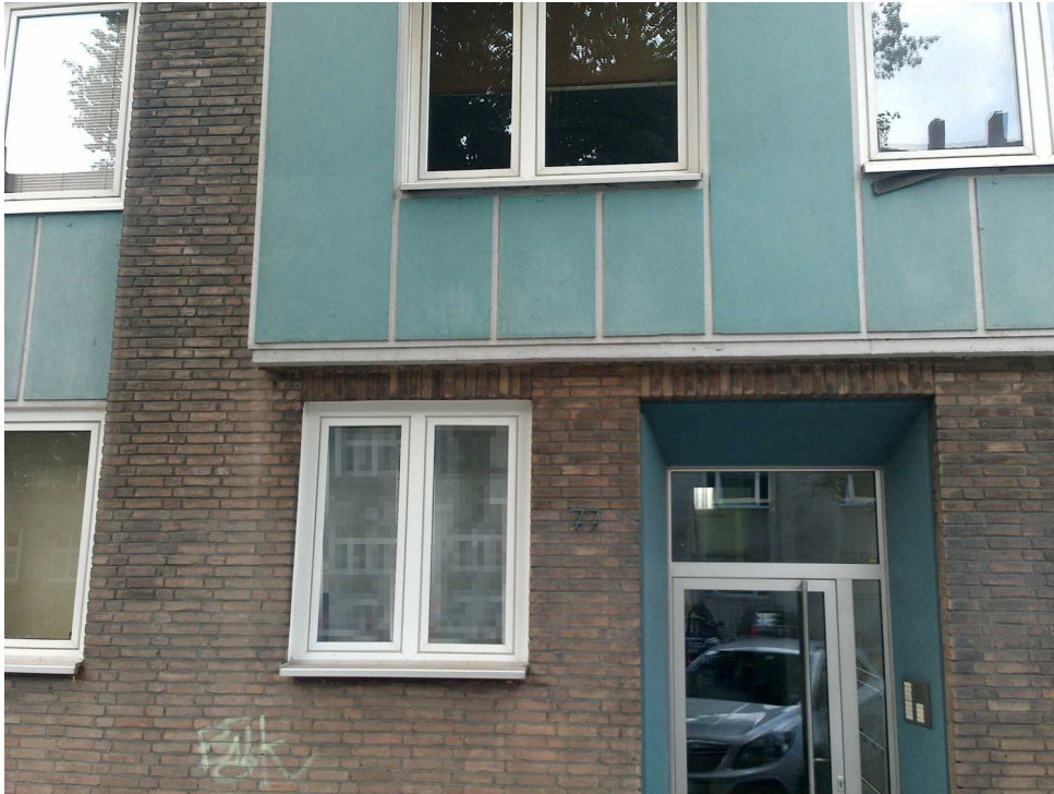
Abbildung 8: Blickrichtung Westen (Juli 2018)