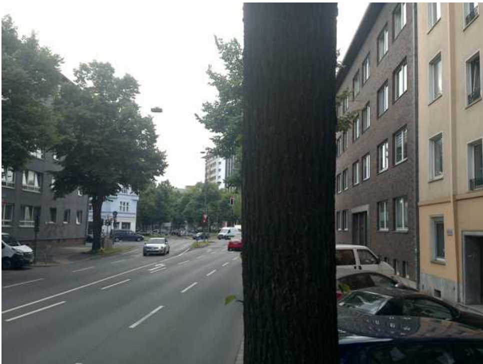
Abbildung 7: Blickrichtung Süden (Juli 2018)