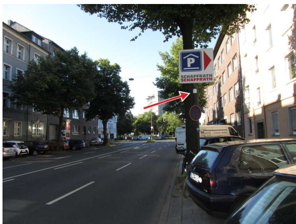
Abbildung 1: Düsseldorf-Bilk