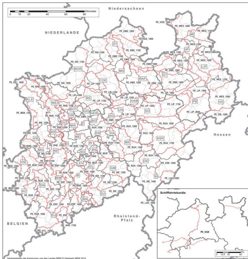
Planungseinheiten und Verwaltungsgrenzen in NRW