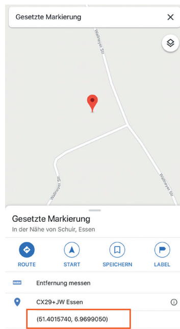
Ansicht mit Koordinaten in Google Maps via iPhone

Nähere Informationen zur Afrikanischen Schweinepest finden Sie auf unserer Homepage: https://url.nrw/ASP