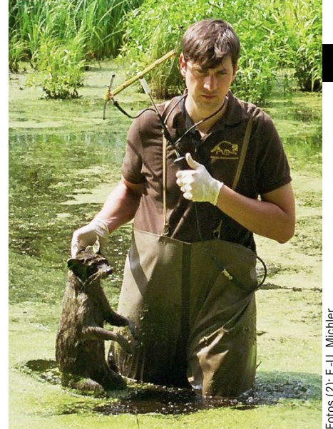
Ein an Staupe verendeter, sendermarkierter Waschbär wird aus dem Sumpf im Mürzitz-Nationalpark geborgen.