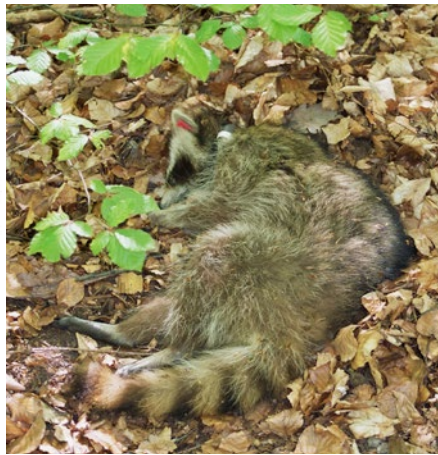
Staupe infizierte Waschbärfähe in komatösem Zustand