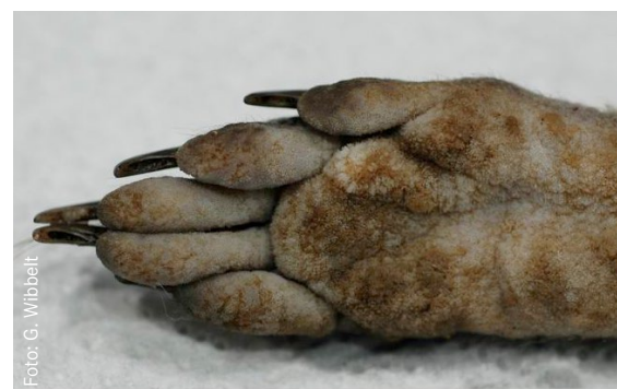
Extreme Verhornung (Hyperkeratose) auf der Sohle eines an Staupe verendeten Waschbären

wegens des Abweichens vom typischen Verhalten (fehlende Scheu vor Menschen, Schläfrigkeit, Bewegungsstörungen) oder Aggressivität Füchse auf Staupe untersucht (Durchseuchungsrate: 30,5 Prozent), in Niedersachsen lag sie 2011 bei 36 Prozent.