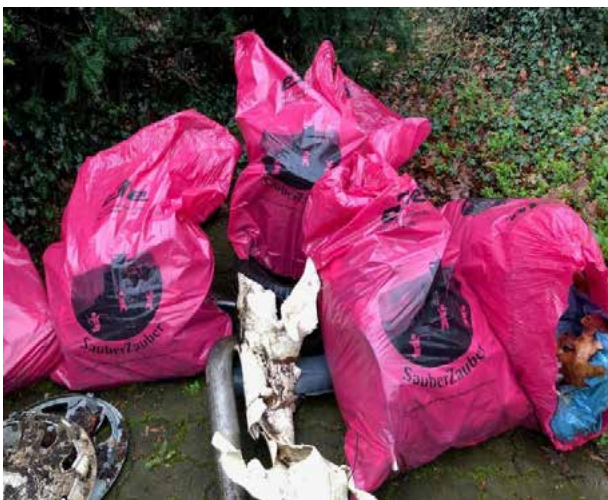
Das Ergebnis einer erfolgreichen Aufräumaktion