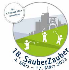
Das Logo der 18. SauberZauber-Aktion in Essen

Auch besteht in manchen Städten und Gemeinden die Möglichkeit, sich an den von dort organisierten Aufräum-Aktionen zu beteiligen, wofür auch Werbematerial zur Verfügung gestellt werden kann. Diese kommunal organisierten Aufräum-Aktionen finden in der Regel zu einem festgelegten Zeitraum statt. In Essen findet die Aktion „SauberZauber“ einmal jährlich statt. Mit der Bereitstellung von Logo und Plakaten wird eine einfache Kommunikation ermöglicht.