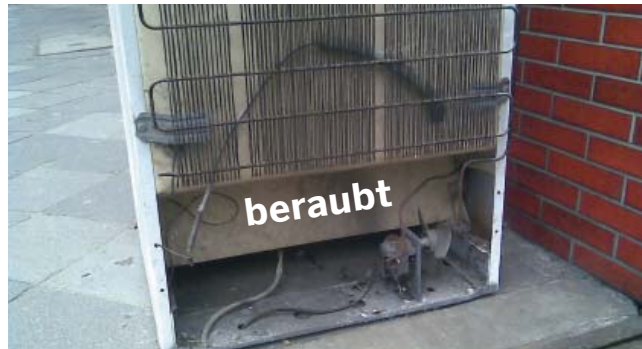
Kühlgerät bei dem der Kompressor geraubt wurde

Bis zu 40 % der Altgeräte, die durch die Straßensammlung erfasst werden, sind in erheblichem Maße beschädigt. Helfen Sie bitte mit!