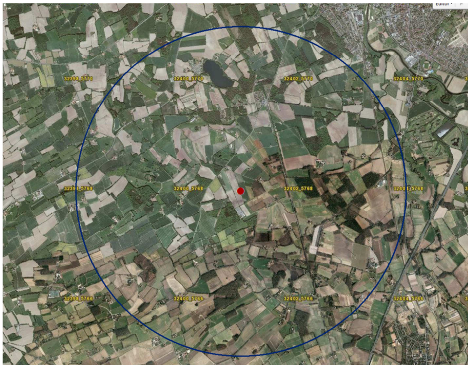
Abb. 1: Geplanter Standort einer Windkraftanlage (fiktive Planung) und Untersuchungsraum mit Radius der 15-fachen Anlagenhöhe (3 km).

Der Untersuchungsraum zur Ermittlung des Ersatzgeldes (€/m Anlagenhöhe) ist der Bereich um die Windenergieanlage mit dem Radius der 15-fachen Anlagenhöhe. Der Radius des Untersuchungsraumes beträgt also 15 * 200 \text{ m} = 3 \text{ km} (Abb. 1).