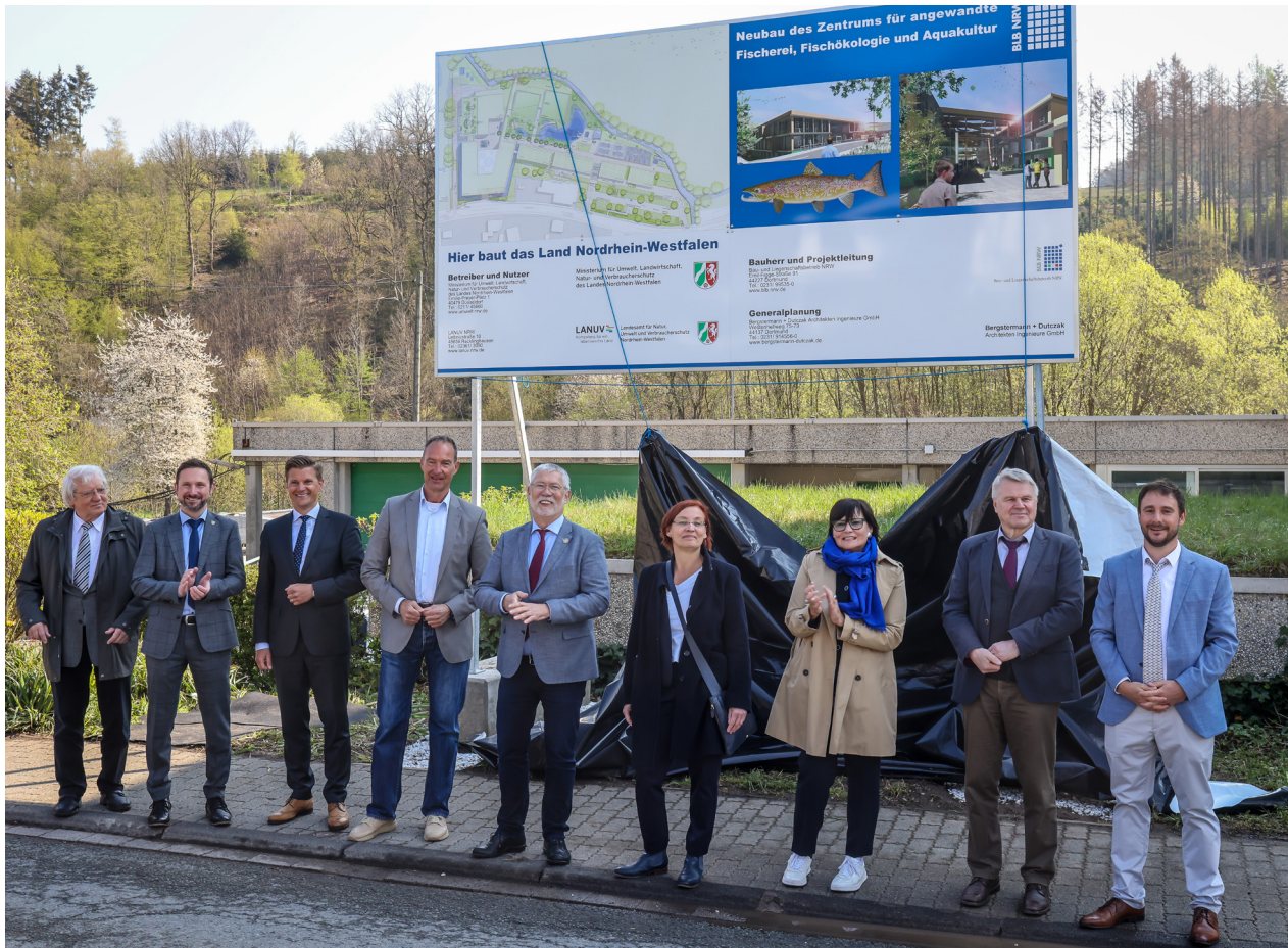
Enthüllung des Bauschildes für den Neubau des „Zentrums für angewandte Fischerei, Fischökologie und Aquakultur“

Die LANUV-Pressemitteilung finden Sie hier :